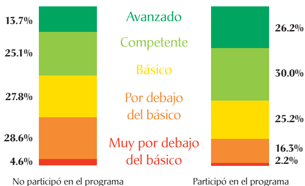
2003-2004 CST Math, Del 2º al 4º Grado n=3112 (estudiantes participantes)

Muchos menos estudiantes se encontraron en las categorías de bajo rendimiento.